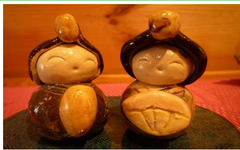
ギャラリーぶるーね 長浜 焼