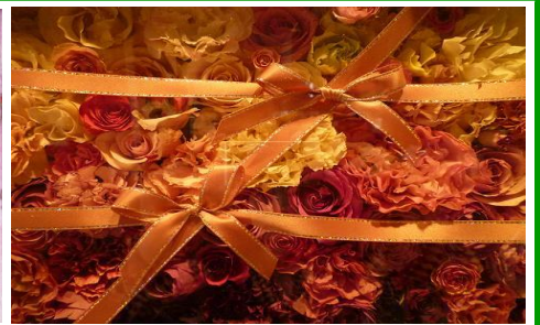
ドライフラワー工房 彩 山田 千里